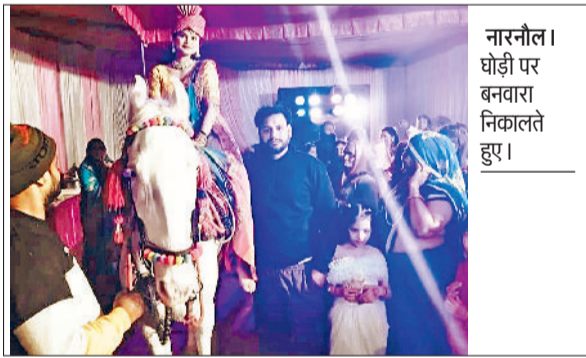
नारनौल। घोड़ी पर बनवारा निकालते हुए।