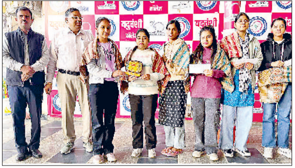
महेन्द्रगढ़। विजेता बच्चों को सम्मानित करते हुए।