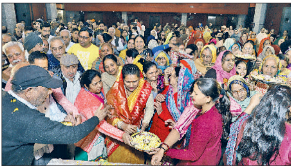
भिवानी। श्रीकृष्ण कथामृत में शामिल श्रद्धालु।