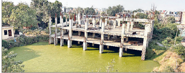
नारनौल। अधूरे भवन के बेसमेंट में पानी।

जानकारी के मुताबिक साल 2017 में सीएम मनोहरलाल ने नागरिक अस्पताल में 100 बेड को बढ़ाकर 200 बेड का नया अस्पताल बनाने की घोषणा की। दो साल बाद नवंबर-2019 में इसका टेंडर छोड़ा गया। साल 2020 में एजेंसी ने काम शुरू किया। तब इस वक्त के टेंडर में तय किया गया था कि बेसमेंट के अलावा सात मंजिला भवन बनेगा। इस भवन का कुल कवर एरिया 1.61 लाख स्क्वियर फिट होगा। भवन में लिफ्ट की भी सुविधा होगी। जिस एजेंसी का यह टेंडर दिया उसने करीब 24 फीसदी काम किया और इस काम के बदले उसे 4510.08 लाख दिए गए। इसी दौरान