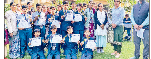
महेन्द्रगढ़। विजेता हाउस को सम्मानित करते हुए।

टैगोर सीनियर सेकेंडरी स्कूल में कक्षा पांचवीं से आठवीं के विद्यार्थियों के लिए अंग्रेजी क्विज प्रतियोगिता आयोजित की गई। इस प्रतियोगिता को उद्देश्य विद्यार्थियों में भाषा-ज्ञान, सामान्य अधिगम, टीम-वर्क तथा त्वरित सोचने की क्षमता को विकसित करना था। प्रतियोगिता में विद्यालय के सभी आठ हाउस विलियम शेक्सपियर हाउस, विलियम वड्सवर्थ हाउस, जॉन कोट्स हाउस, पर्सी विश शेली हाउस, रॉबर्ट ब्राउनिंग हाउस, टीएस इलियट हाउस, रॉबर्ट ब्रॉन्ट हाउस और डब्ल्यू. बी योर्ट्स हाउस ने उत्साहपूर्वक भाग लिया। कड़ी प्रतियोगिता के बाद टीएस इलियट हाउस ने सर्वाधिक अंक प्राप्त कर प्रथम स्थान हासिल किया, जबकि