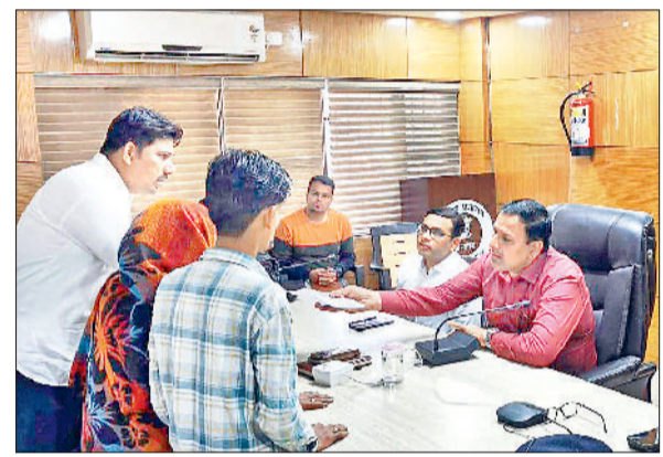
नारनौल। दरबार में राशन कार्ड जोड़ने की गुहार लगाती महिला।