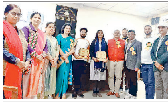
महेन्द्रगढ़। विजेताओं को सम्मानित करते हुए।